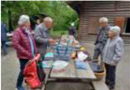
Vorbereitungen zum Essen werden getroffen