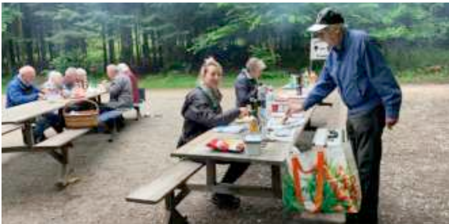
Und danach das Köstliche verspiesen