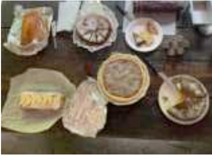
Zum Kaffee «avec» das tolle Dessertbuffet (Kuchen in verdankenswerter Weise wieder- um durch die Frauen der Komitee-Mitglieder selbst gebacken)