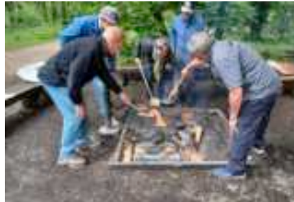
Es wurde eifrig gegrillt und mit den Pfännli gekocht