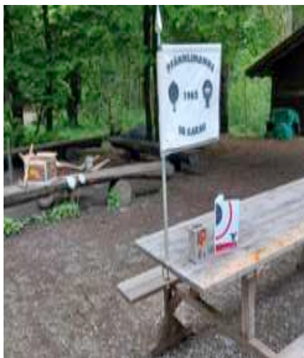
Die Standarte, das Kässeli und der «Aarauer Schütz» sind bereit