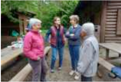
Gespräche durften selbstverständlich nicht fehlen