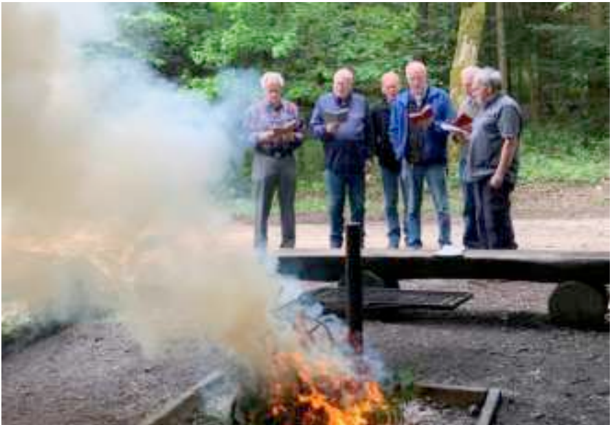
Das Rauchzeichen an unsere verstorbenen Pfännlimannen und das Lied «ich hatt' einen Kameraden» fehlen nie