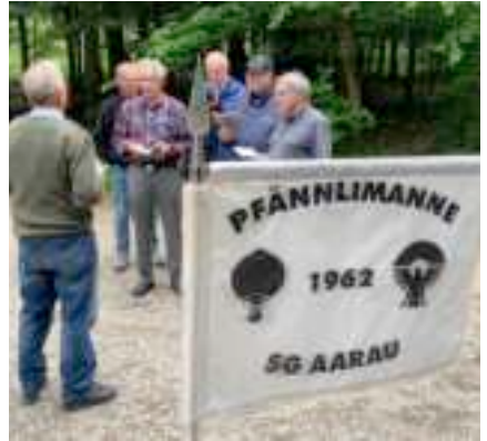
Gesungen wurde selbstverständlich auch