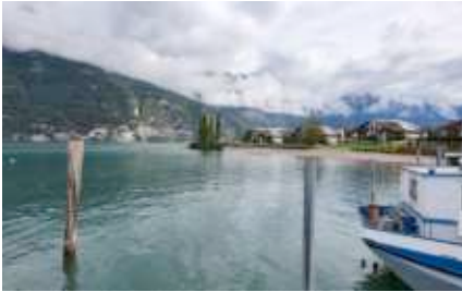
Churfürsten im Nebel