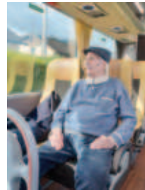
Noch ein paar weitere Schnappschüsse