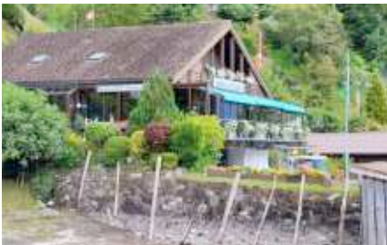
Restaurant Seehus, wo wir ausgezeichnet gepflegt wurden