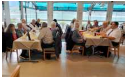
Die Plätze sind eingenommen, das Essen kann kommen