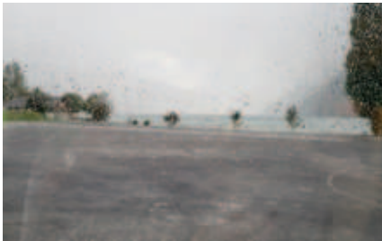
Mit dem Wetter hatten wir ganz grosses Glück. Immer wenn wir draussen waren, schonte es, und als wir in Walenstadt abfuhren, regnete es richtig stark.