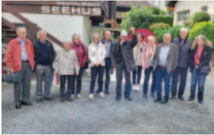
Bereit für den Marsch nach Au