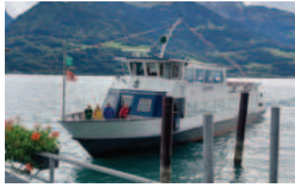
Haltestelle Au; Weiterfahrt nach Walenstadt