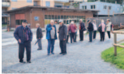
Warten auf das Schiff