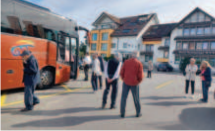
Zwischenhalt in Siebnen im Hotel Schäfli