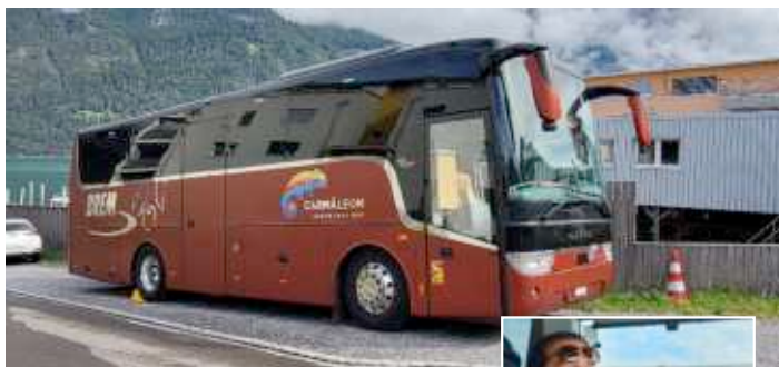
Unser Car mit Chauffeur Georgios