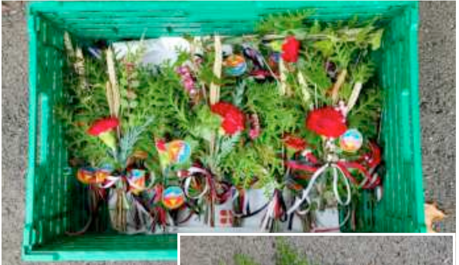
Die wiederum von Urs und Franziska Arn angefertigte sehr schönen Sträusschen