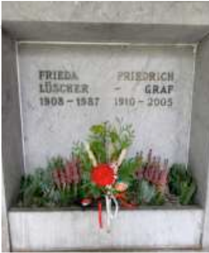
Auch unser Pfännlimannen-Vater erhielt selbstverständlich ein Sträusschen