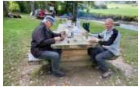
Die selbst zubereiteten Menues werden verspiessen