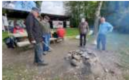
Warten auf gutes Gelingen