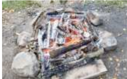
Bald schon können die Pfännli auf die Glut gelegt werden