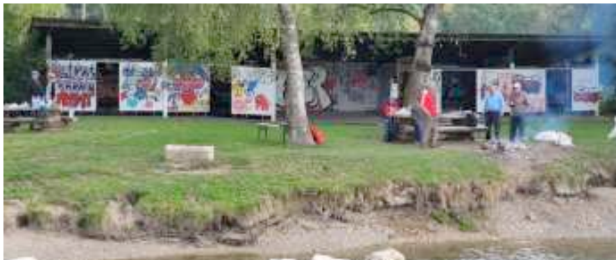
Die leider sehr verunstaltete Aabachbadi