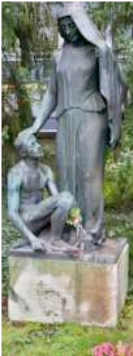
Das Gemeinschaftsgrab des Friedhof Aarau