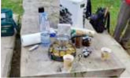
Heiri's Kaffee-Bar, eine tolle Einrichtung