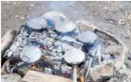
Feine Däfte entweichen den Pfännli