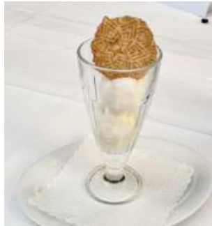
...und der Coupe Colonel