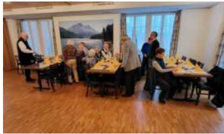
Die Teilnehmer/innen sind im Anmarsch.