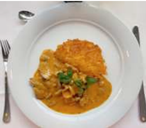
Das ausgezeichnet zubereitete «Hausi's Geschnetzletes» vom Schweinsfilet mit Rösti...