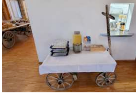
Der grosse und der kleine Heuwagen