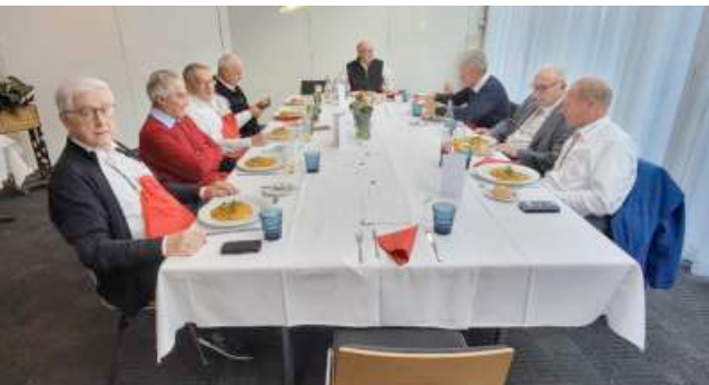
Bereit zum Genuss des Mittagessens