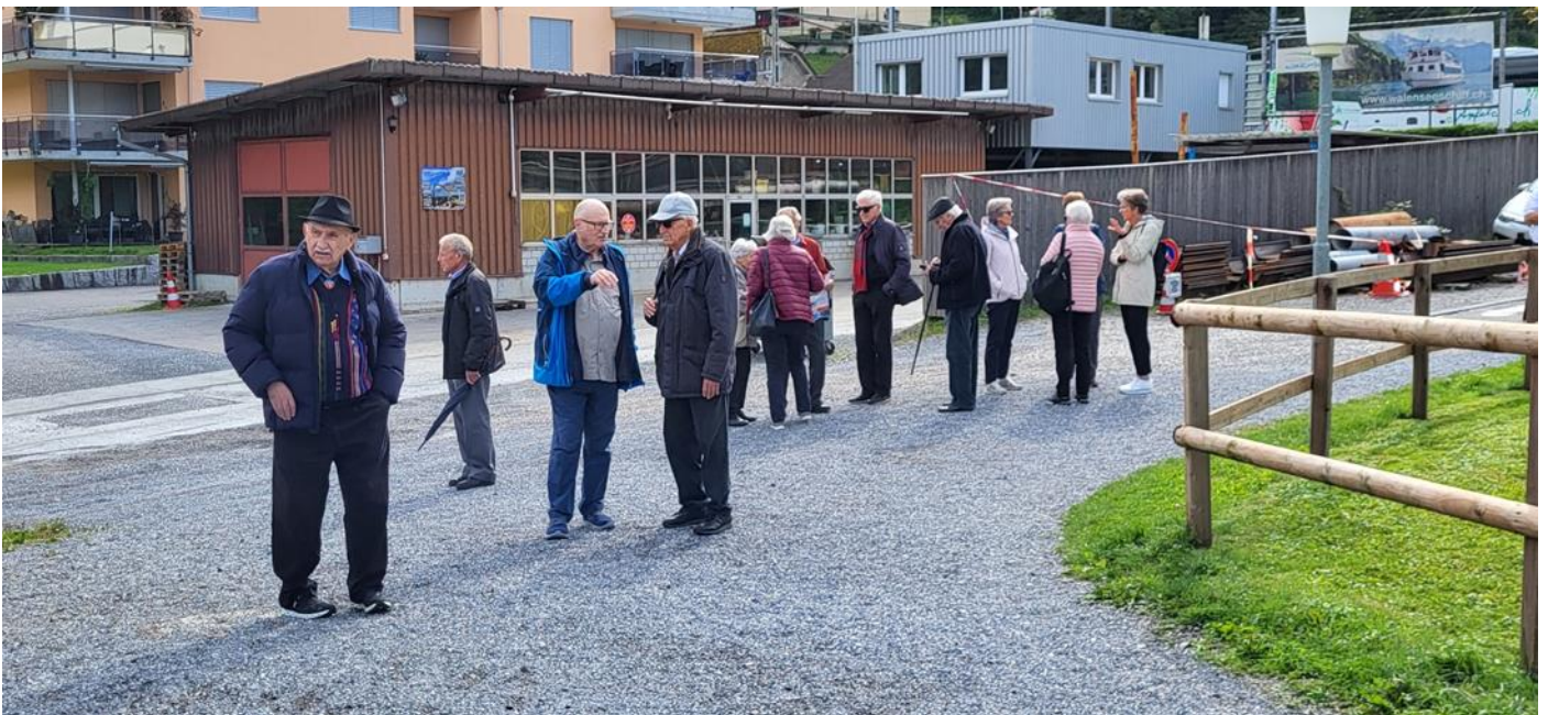
Warten auf das Schiff