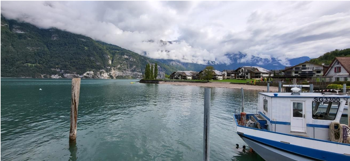
Churfürsten im Nebel