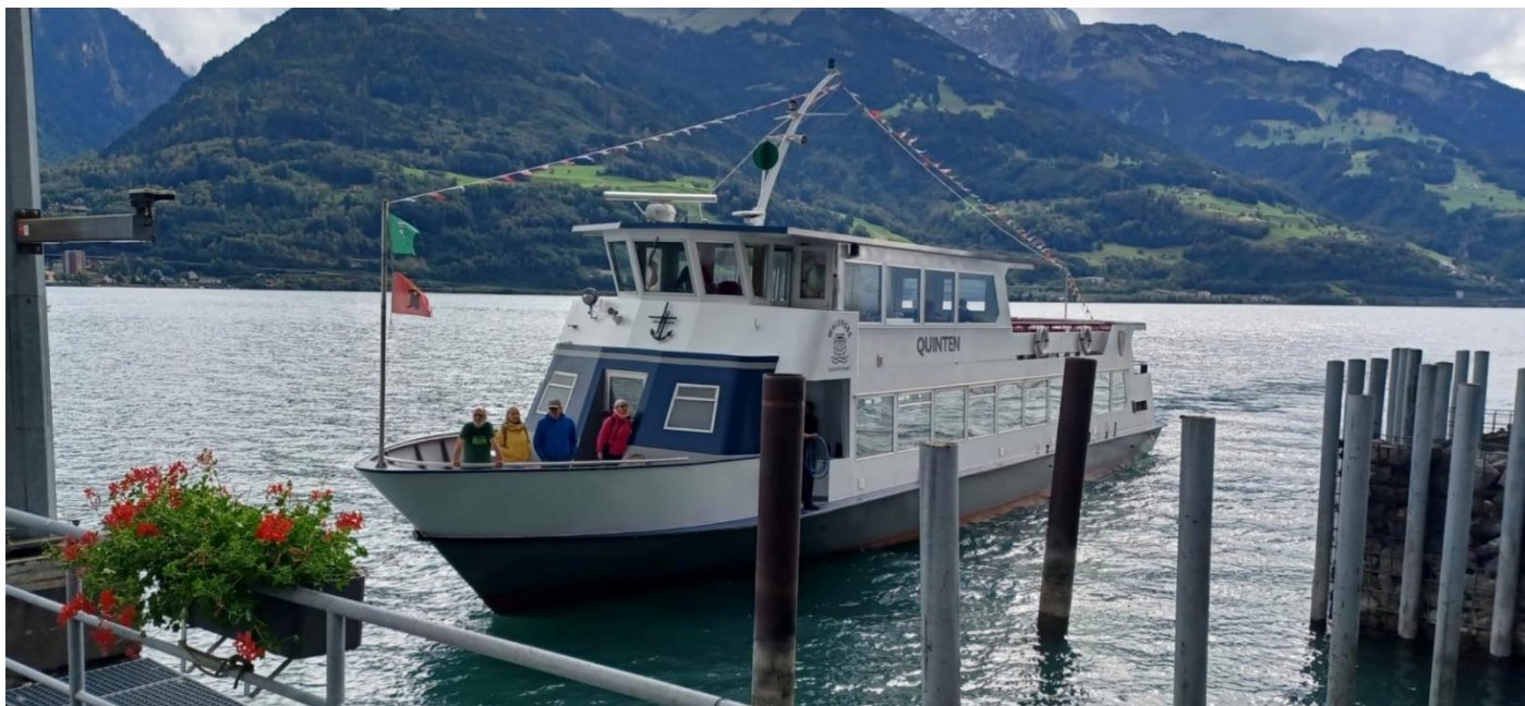
Haltestelle Au; Weiterfahrt nach Walenstadt