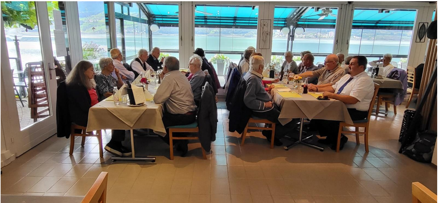
Die Plätze sind eingenommen, das Essen kann kommen