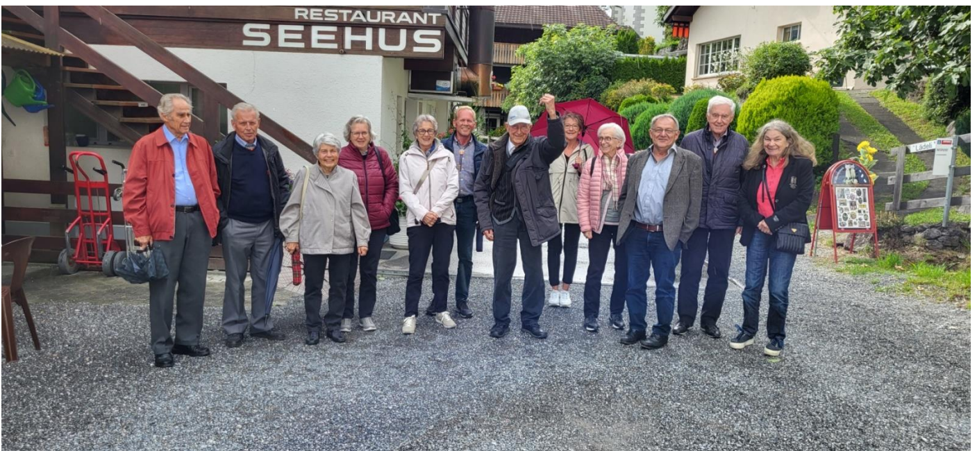
Bereit für den Marsch nach Au