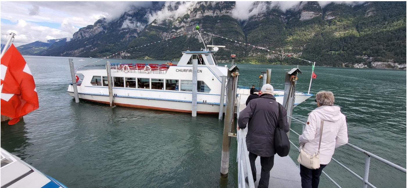
Schiff ahoi !