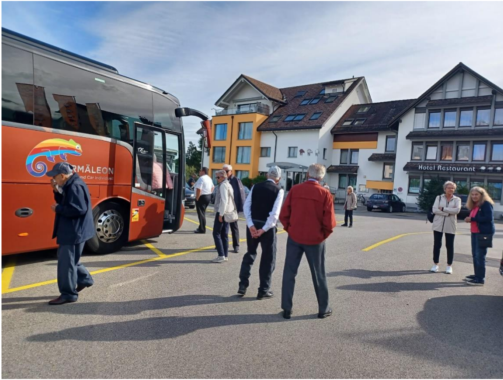
Zwischenhalt in Siebnen im Hotel Schäfli