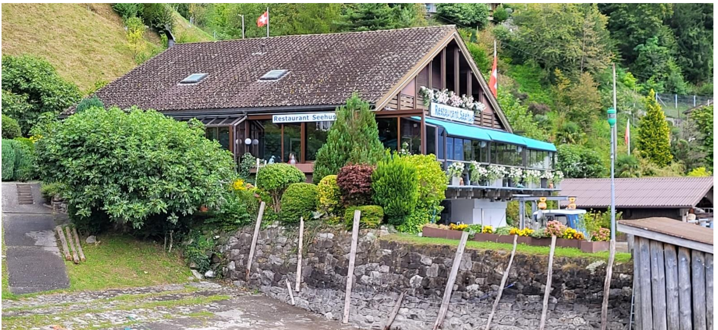
Restaurant Seehus, wo wir ausgezeichnet verpflegt wurden