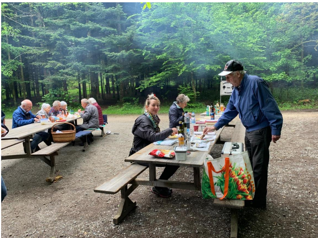
und danach das Köstliche verspiessen