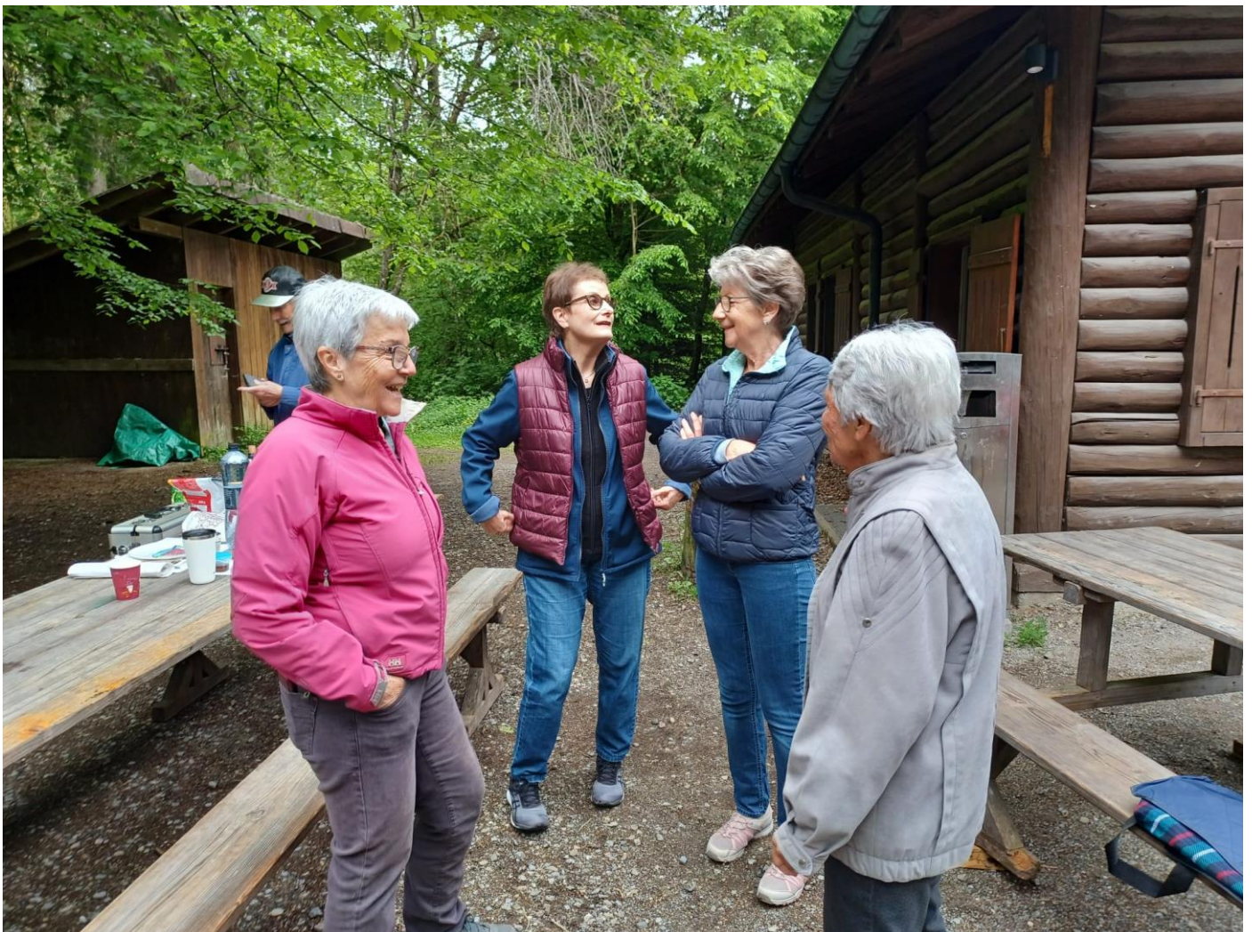
Gespräche durften selbstverständlich nicht fehlen