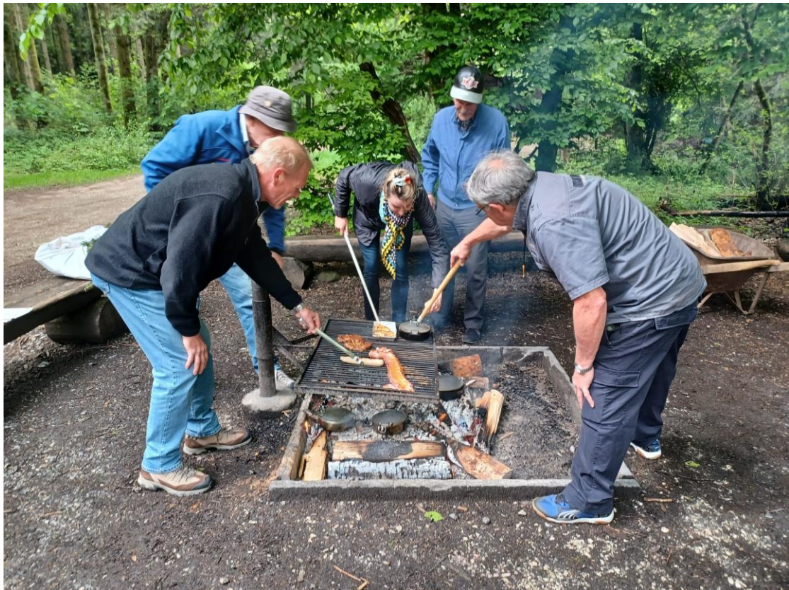
Es wurde eifrig gegrillt und mit den Pfännli gekocht