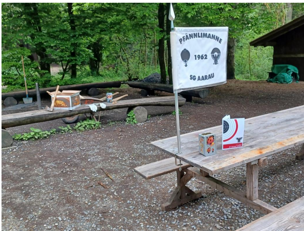
Die Standarte, das Kässeli und der „Aarauer Schütz“ sind bereit