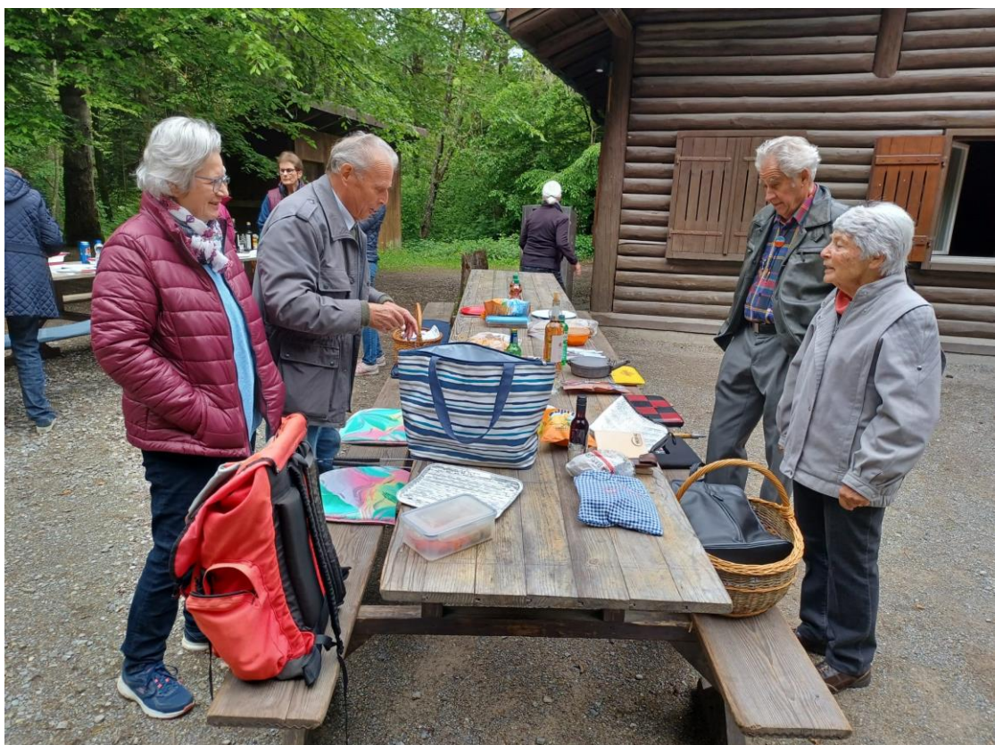
Vorbereitungen zum Essen werden getroffen