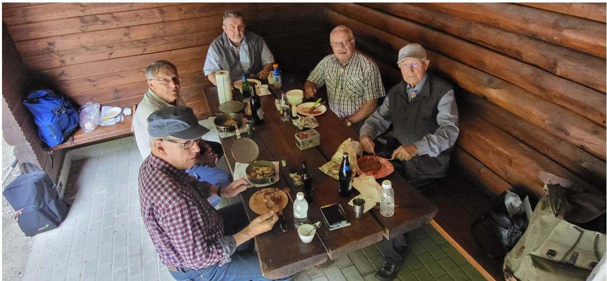
Nach dem „Brutzeln“ kann gespiesen werden