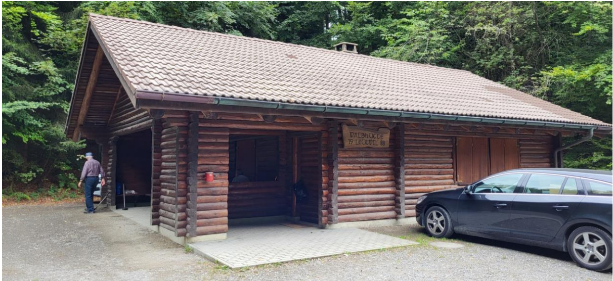
Die schöne Waldhütte von Leutwil