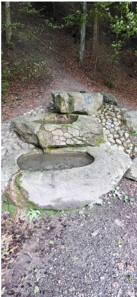
Der Familienbrunnen der Familie von Lüttwyl