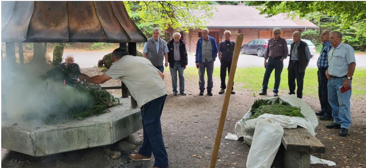
Das Rauchzeichen an unsere verstorbenen Pfännlimanne sowie das Lied „ich hatt' einen Kameraden darf nie fehlen. Zum Schluss stimmten wir noch das Lied „Im schönsten Wiesengrunde“ an.